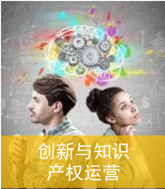
创新与知识产权运营

课程将引入一些模型，指导学生通过 4 个模块的学习，打破思维枷锁，发现新灵感、新思路，最终循序渐进地掌握处理数据。