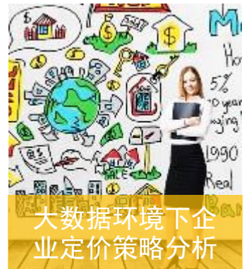
大数据环境下企业定价策略分析

在大数据环境下，价格歧视早已是商业惯用的一种手段，商家通过设置各类栅栏来制定差别定价（对价格敏感的顾客最容易越过栅栏），典型如航空公司机票的定价法则，并且在已经完备的机票定价法则之外，廉价航空也能从缝隙中找到被传统航空公司放弃、对价格高度敏感的用户群，再以其差异化的服务增加付费。课程主要涉及消费性企业的交易级数据库架构及数据结构，基本需求价格模型及主流价格敏感性模型，主要消费者行为分析的机器学习模型及其应用。