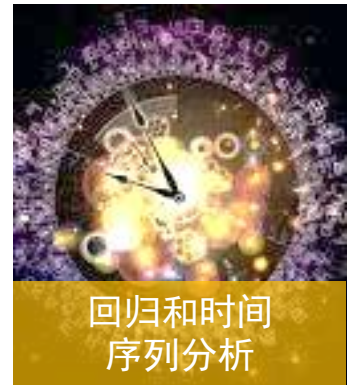
回归和时间序列分析

创新的保护：用创新的方式去保护创新。倡导创新文化，强化知识产权创造、保护、运用。 技术商业化的知识产权议题：IPCOC 中国知识产权商业化运营大会将以“国际化运营”为主旨，通过高端对话，介绍分享 PCT 成员国就工业产权保护、运营经验、如何建设高价值专利体系，国内知识产权运营机构如何高标准运营专利等议题。